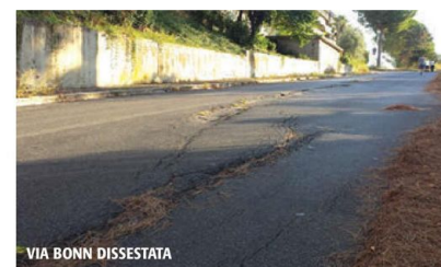
VIA BONN DISSESTATA